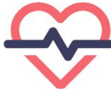
Hábitos de vida cardiosaludables