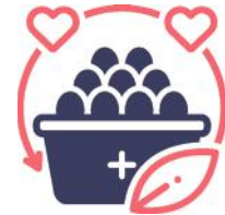
Nutrición, hidratación y descanso