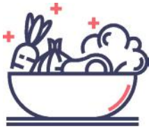
Alimentación saludable "Dieta Mediterránea"

Las presentaciones, ponencias y mesas redondas contarán con la participación de especialistas en los siguientes sectores: