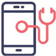
Digitalización en la salud