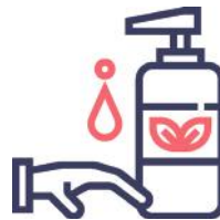
Nuestra piel, fiel reflejo de nuestro interior