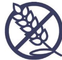
Intolerancias y alergias