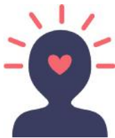
Bienestar emocional y salud