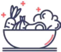
Alimentación saludable "Dieta Mediterránea"

Las presentaciones, ponencias y mesas redondas contarán con la participación de especialistas en las siguientes áreas: