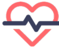
Hábitos de vida cardiosaludables