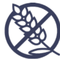
Intolerancias y alergias