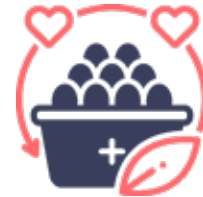
Nutrición, hidratación y descanso