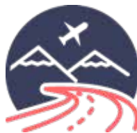
Turismo y ocio saludable