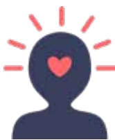
Bienestar emocional y salud