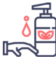
Cuidados de la piel