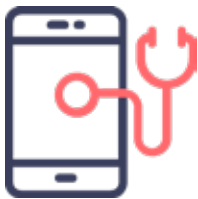
Digitalización en la salud